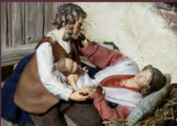
Heimatliche Krippe mit selbst bekleideten Holzfiguren der Firma Heide, Lajen/Italien

Spielerbogen für kleine Entdecker: Rundgang für Kinder mit Rätsel- und Zeichenaufgaben (0,50 EUR, an der Museums- kasse erhältlich).