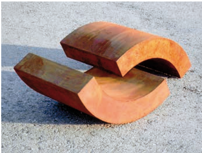
„O.T.“ (aus dem Zwei-Bogen-Zyklus), Stahl, ca. 160 x 60 x 40 cm

2005 Kunstpfad Krumbach 2006 Memminger Meile 2011 „Parknovellen 3 KARL K. MAURER“ Ausstellung der Ecke Galerie im Park des Kurhauses Göggingen 2012 Ballonmuseum Gersthofen