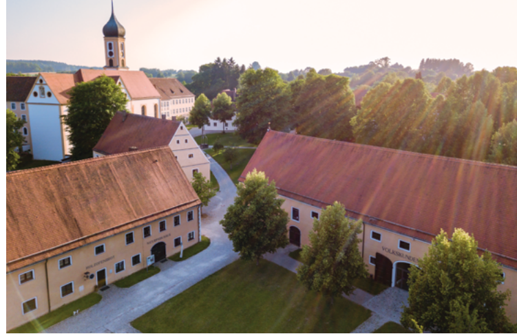
Das Museum Oberschönenfeld und das Naturpark-Haus auf dem Areal der Zisterzienserinnenabtei.

Referentin: Michaela Schmid, Kräuterexpertin Kosten: 10,00 EUR zzgl. 5,00 EUR für Material